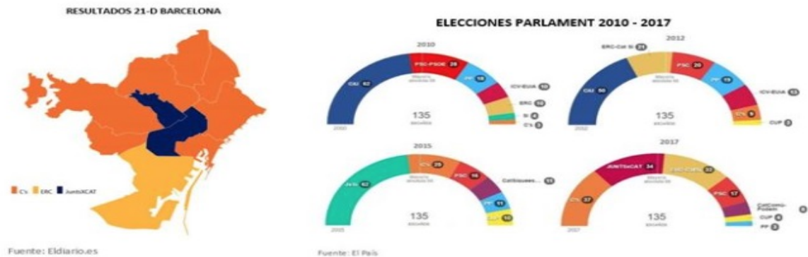
Distribución votos Barcelona y diputados